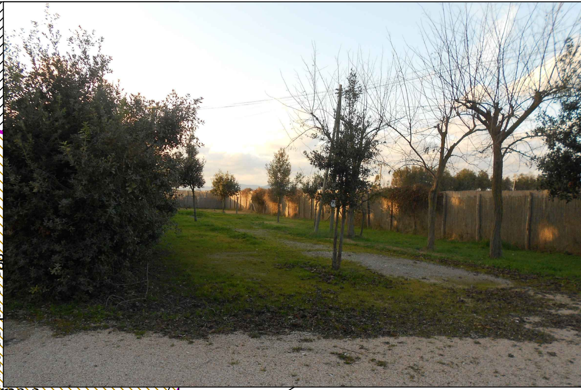
Superficie interna a perimetro F3